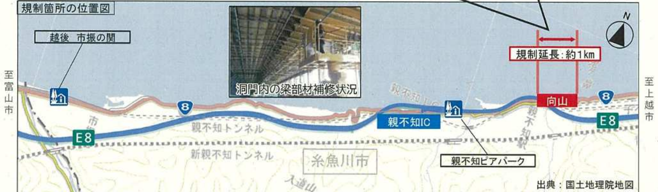
規制箇所の位置図