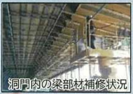
洞門内の梁部材補修状況