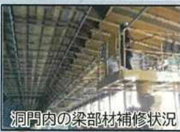
洞門内の梁部材補修状況