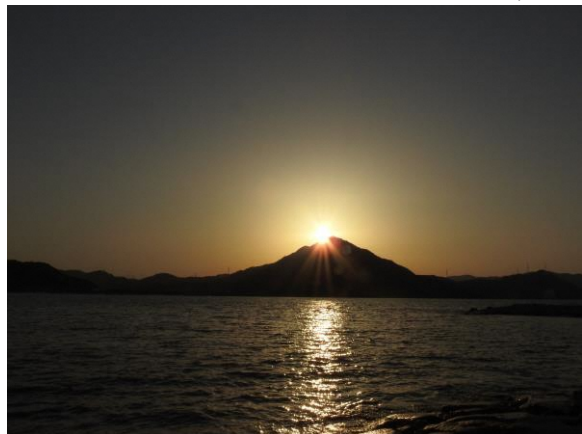
撮影場所：福井県大飯郡高浜町（若宮海岸）