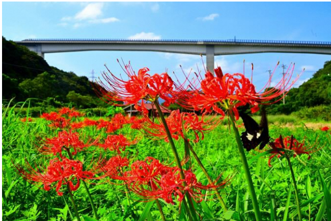
撮影場所：福井県敦賀市鳩原