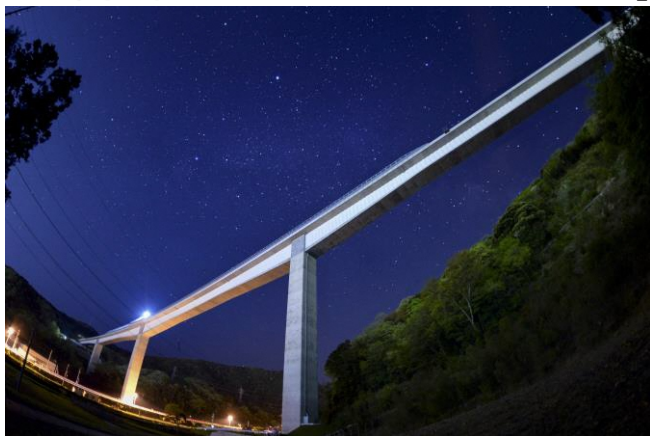
撮影場所：福井県敦賀市衣掛町