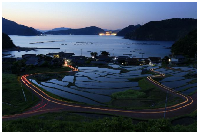
撮影場所：福井県大飯郡高浜町（日引の棚田）