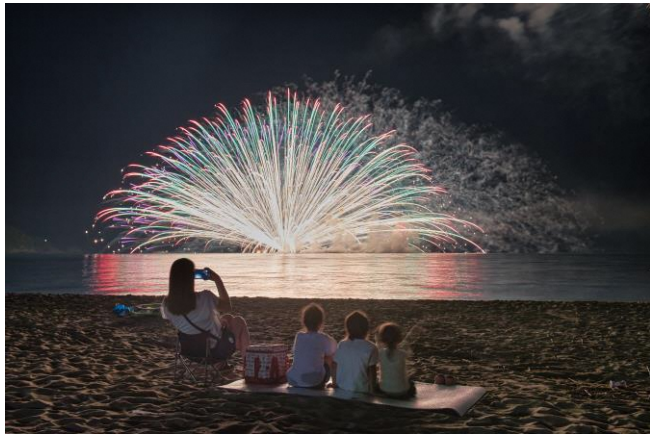
撮影場所：福井県大飯郡高浜町（若狭高浜花火大会）