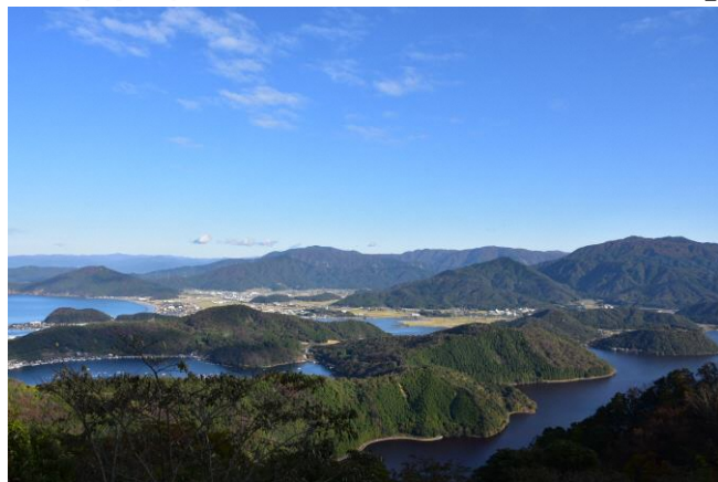
撮影場所：福井県美浜町・若狭町（三方五湖）