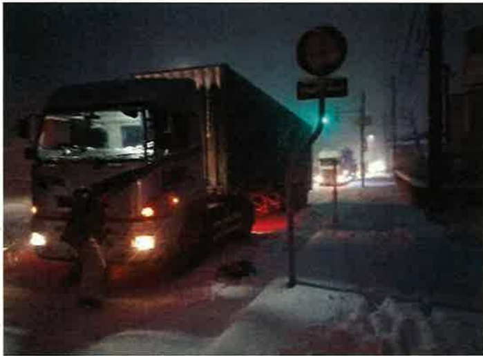
令和4年12月19日 8号 上り 福井県あわら市笹岡