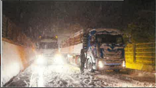
② 福知山市夜久野町小倉