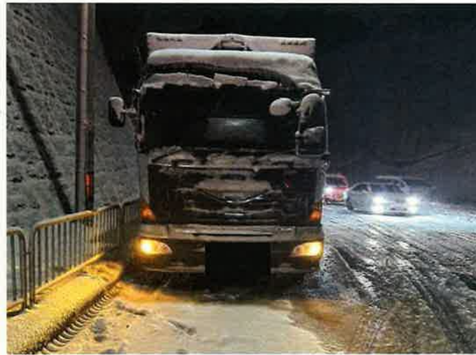
令和4年12月24日 国道1号 上り 大津市逢坂一丁目